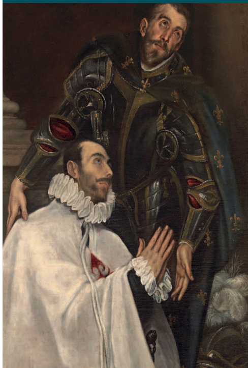
Seguidor de El Greco, Julián Romero y su santo patrono (detalle), 1612-1618, Museo Nacional del Prado, Madrid